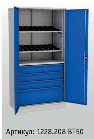
Артикул: 1228.208 BT50