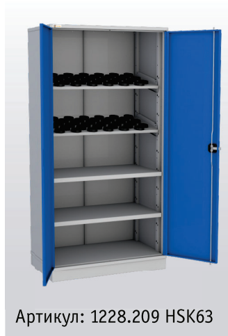
Артикул: 1228.209 HSK63