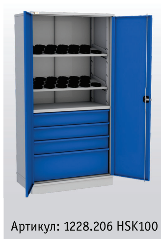
Артикул: 1228.206 HSK100

ПРОИЗВОДСТВЕННАЯ МЕБЕЛЬ И СИСТЕМЫ ХРАНЕНИЯ МЕХАНИКА