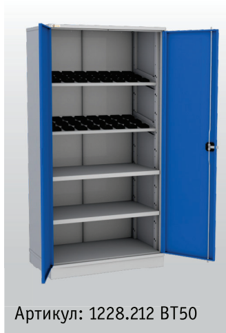
Артикул: 1228.212 BT50