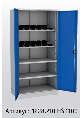
Артикул: 1228.210 HSK100