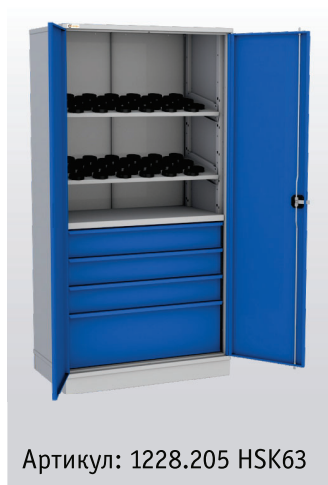
Артикул: 1228.205 HSK63