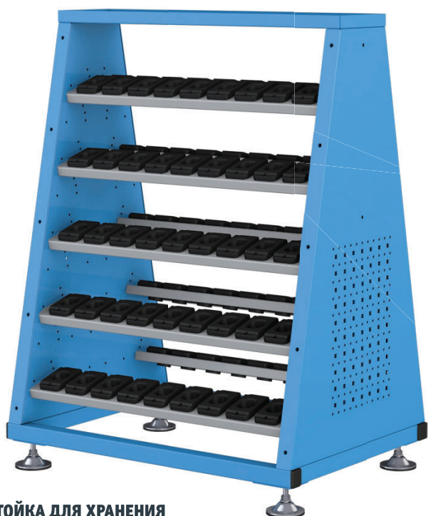
СТОЙКА ДЛЯ ХРАНЕНИЯ

Поставляются в собранном виде и сразу готовы к эксплуатации