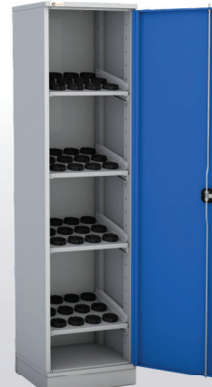
Артикул: 1285 для HSK63