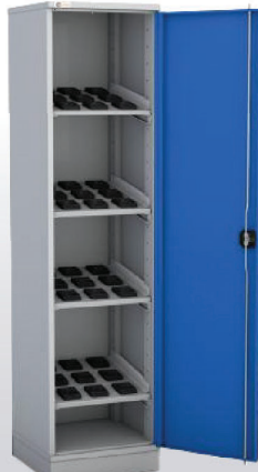
Артикул: 1285.108 для BT50